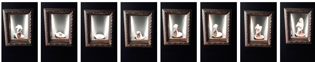
LES NAISSANCES DE VÉBUS